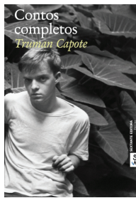
Contos Completos, Truman Capote, Sextante Editora