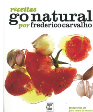
Receitas Go Natural, Frederico Carvalho, Tinta-da-China