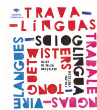
Trava-Línguas, Dulce de Souza Gonçalves, Planeta Tangerina