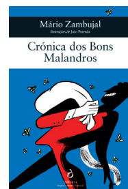
Crónica dos Bons Malandros, João Fazenda (ilustração), Quetzal