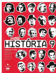
História – 9.º, Ana Oliveira e outros, Texto Editora