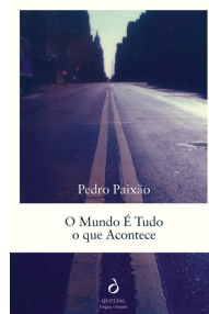
O Mundo É tudo o Que Acontece, Pedro Paixão (texto e fotografia), Quetzal