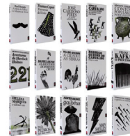
Colecção BisLeya, Vários, LeYa